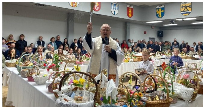
ADORACJA PANA JEZUSA W GROBIE